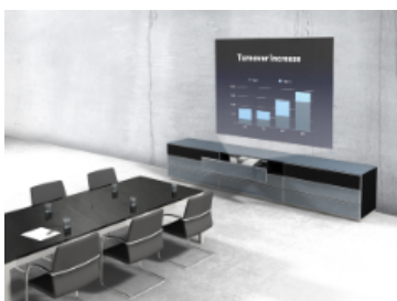
Elegant und praktisch: CATENA als multimediale Präsentationslösung für Besprechungszimmer, Schulungsräume und Büros