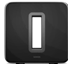
Sonos Sub Subwoofer