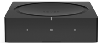
Sonos Amp Verstärker