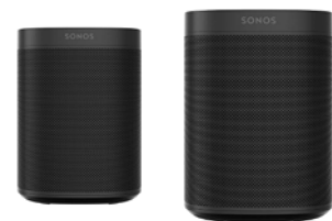
Sonos One / One SL Surround Speaker